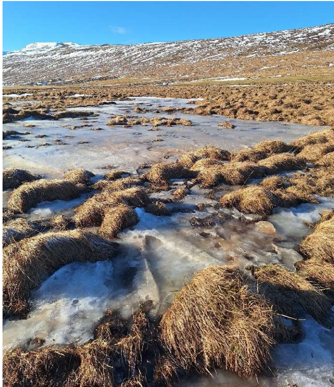
Mynd 4. Mógröf [3221-3], full af vatni og frosin. Horft til SV, Ásbjarnarstaðir í baksýn.

Mógrafirnar voru fullar af vatni og frosnar þegar skráning fór fram. Þó voru útlínur þeirra greinilegar. Grafirnar liggja hálfpartinn í „L“ og er svæðið um 36x40m að stærð. Tunguá rennur skammt SA af gröfunum.