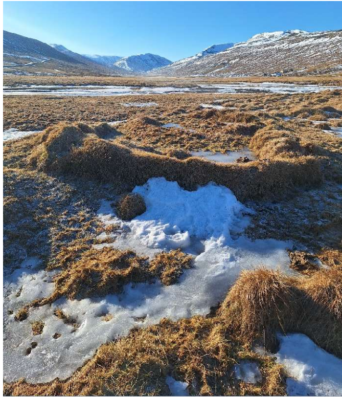
Mynd 5. Mókofi [3221-4], horft til suðurs inn Þorgrímsstaðadal.

Tóftin er tískipt og snýr NNA-SSV. Utanmál tóftarinnar er um 6,5x4m. Veggir eru lágir en þó greinilegir, mest um 30cm háir og 80cm breiðir. Hér var mó hlaðið upp (munnleg heimild: Loftur Guðjónsson, 11.03.2024).