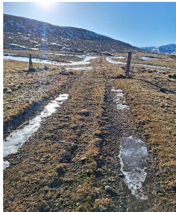
Mynd 2. Heimreið [3221-1] horft til suðurs heim að bæ i Tungu.

Heimreiðin var áður vegur inn dalinn og fór vegurinn þá í gegnum hlaðið í Tungu og áfram suður úr, svo yfir á til Ásbjarnarstaða. Heimreiðin er uppbyggð með möl, ekki hlaðin, og var sú