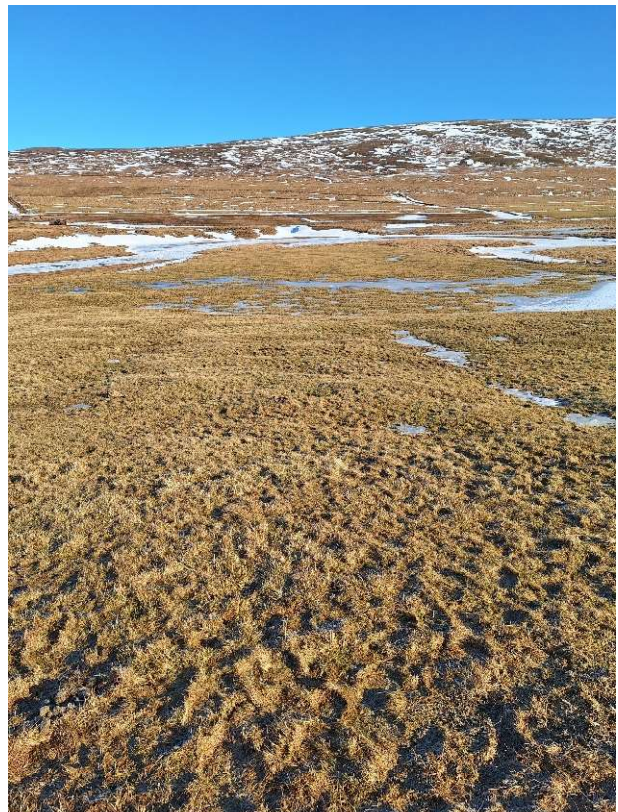
Mynd 3. Þúst [3221-2], horft niður til vesturs, tún á Bæjarnesi í baksýn.

Í dokkinni eru þrjár upphækkanir sem liggja NA-SV. Upphækkanirnar eru allar um 2m breiðar og um 50cm er á milli þeirra. Hæð er um 20-30cm. Dokkin gæti verið útmörk útihúss sem sléttað hefur verið yfir, og upphækkanirnar merki um innri rými. Svæðið er grasi gróið og ekkert grjótt sést.