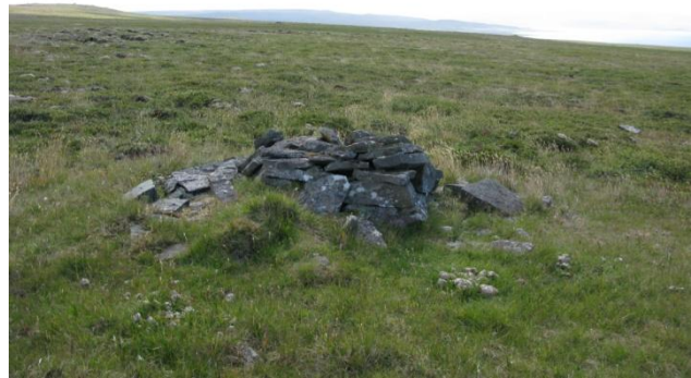
Mynd 3. Stelpa.