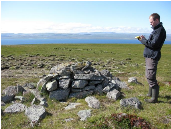
Mynd 2. Flúruvarða.