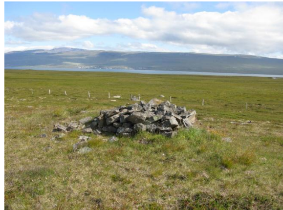
Mynd 1. Jóhönnuvarða.

Hætta: Varðan er innan framkvæmdasvæðis og því í mikilli hættu