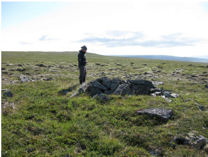
Mynd 4. Kerling. Ljósmynd. GSS.