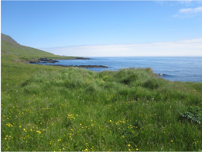
Mynd 7. Tóft nr. 7 er fyrir miðri mynd. Horft er til norðaustur.