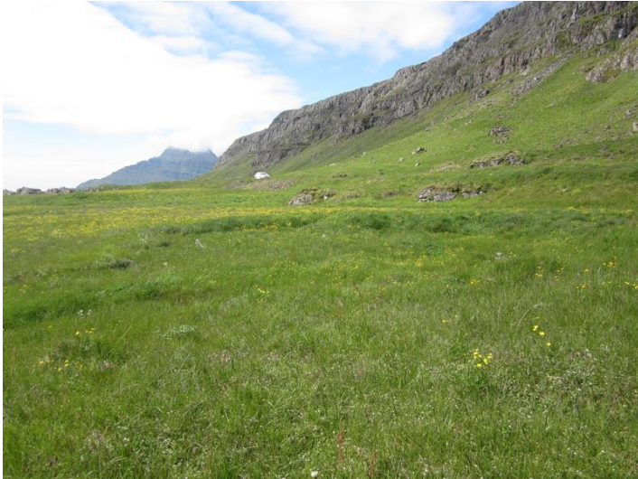
Mynd 8. Mógrafir. Hluti mógrafa nr. 9. Horft er til SV.