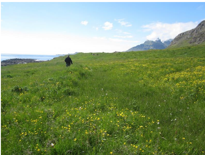
Mynd 6. Horft er til suðurs eftir skurði nr. 6. Til vinstri við skurðinn er garðlag, mögulega uppgröftur úr skurðinum.

Þústin er um 2x5m að utanmáli, þýfð og grasi gróin. Engin veggjalög eru greinileg en þústin sker sig úr umhverfi og mögulega hefur verið þarna einhvers konar mannvirki eða að þarna hefur verið þurrkaður mór eða torf.