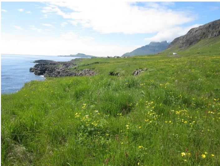
Mynd 9. Þúst nr. 10 er á sjávarbakka. Við hana er mógröf (nr. 9) og þarna hefur mögulega verið þurrkaður eða geymdur mór.

Mógrafirnar ná yfir um 1250m 2 svæði og eru mest um 1,5m á dýpt.