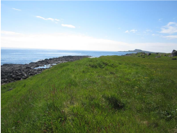
Mynd 5. Þúst nr. 5 fram á brekkubrún. Horft er til suðurs.

Niðurgrofturinn er rúmlega 100m 2 að flatarmáli og mest um 20-30sm djúpur. Þarna hefur líklega verið tekinn mór eða torf.