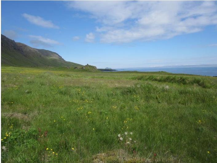
Mynd 1. Matjurtagarður nr. 1. Horft er til norðausturs.

einkum austurveggur, en hrundir á köflum.