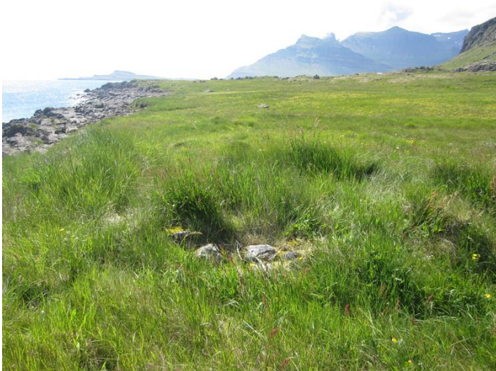
Mynd 2. Tóft nr. 2. Fremst á myndinni sést í grjóthleðslu norðurveggjar. Horft er til suðurs.

Garðlagið hefur afmarkað 13x20m matjurtagarð sem hefur snúið NA/SV. Veggir eru 30-120sm háir og mest um 1,5m á breidd. Þeir eru grasi og mosa grónir, stæðilegir,