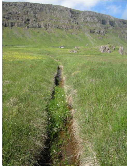
Mynd 3. Horft til NNV eftir skurði nr. 3.