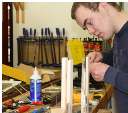
Mynd 5. Gert við gamlan glugga.