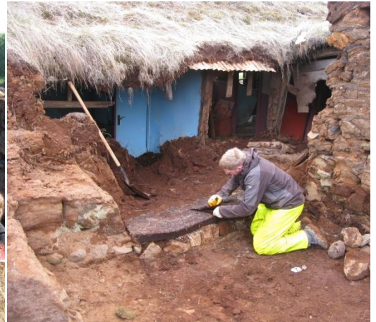
Mynd 8. Strengir skornir saman á neðstu röð grjóthleðslu í suðurvegg búrs.