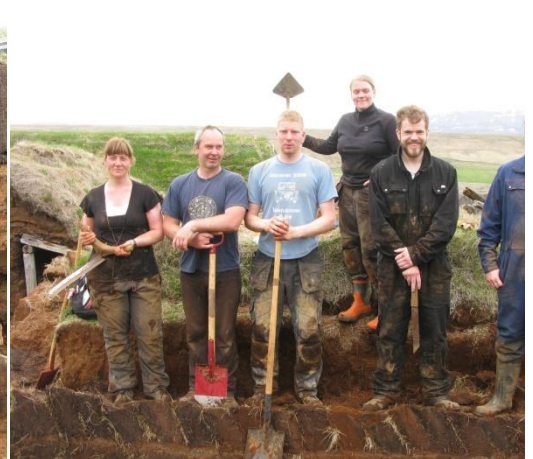
Mynd 10. Nemendur á námskeiðinu ásamt kennara.