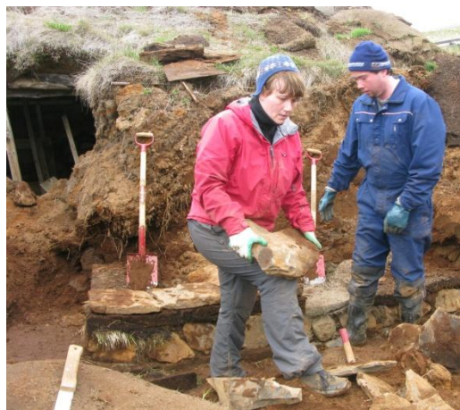
Mynd 9. Grjót valið í vegghleðslu.