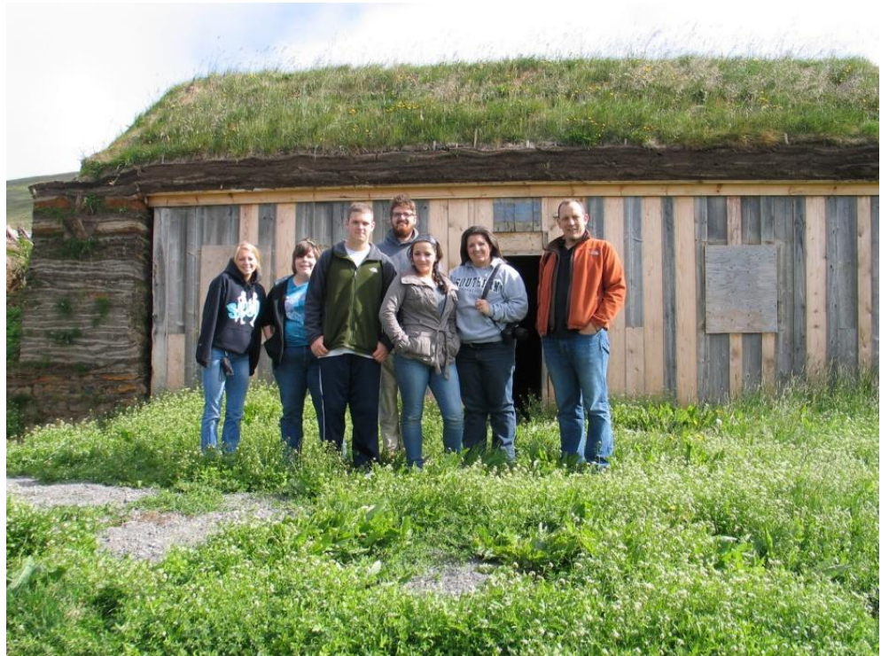
Mynd 2. Hópurinn framan við framhúsið? á Tyrfingsstöðum 15. júlí 2010.

Um miðjan júlí heimsóttu 6 nemendur úr landfræðideild Fylkisháskóla Suður Connecticut (e. Southern Connecticut State University) Tyrfingsstaði ásamt kennara sínum. Þar fengu þau fræðslu um gamalt íslenskt byggingahandverk og kynningu á torfi. Áætlað er að hópur frá sama skóla læri torfskurð og – hleðslu hjá Fornverkaskólanum sumarið 2011.