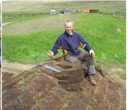
Mynd 12. Torf komið á þak og strompurinn tilbúinn.