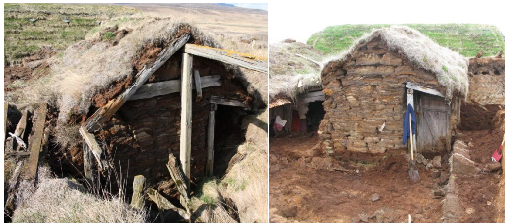
Mynd 1. Búrið fyrir og eftir hreinsun.

Starfsemi Fornverkaskólans var með svipuðu sniði og undanfarin ár. Þrjú námskeið voru haldin 2010; eitt í gluggasmíði, annað í torfhleðslu og á því þriðja var kennd torfhleðsla og grindarsmíði. Alls 16 nemendur sóttu námskeiðin og þar af var einn nemandi að sækja sitt fjórða námskeið. Undirbúningur hófst á Tyrfingsstöðum 22. maí þegar hreinsað var úr búri og hlóðaeldhúsi sem voru námskeiðsefni sumarsins. Í framhaldi af því voru stungnar klömbrur í Tyrfingsstaðalandi en annað efni var skorið í Torfmýri í Blönduhlíð.