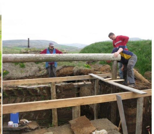
Mynd 14. Mænisásinn settur á sinn stað.