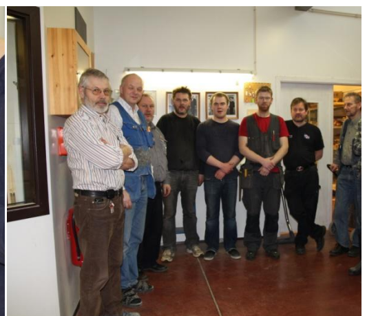
Mynd 6. Nemendur ásamt kennurum.