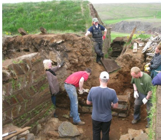
Mynd 11. Hornveggur hlaðinn, grjót og strengur á milli.