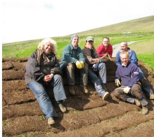
Mynd 13. Hópurinn á splunkunýju þakinu ásamt torfhleðslukennara.