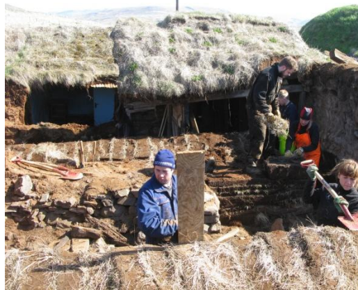
Mynd 7. Unnið af kappi við að snyrta og hlaða vegg.